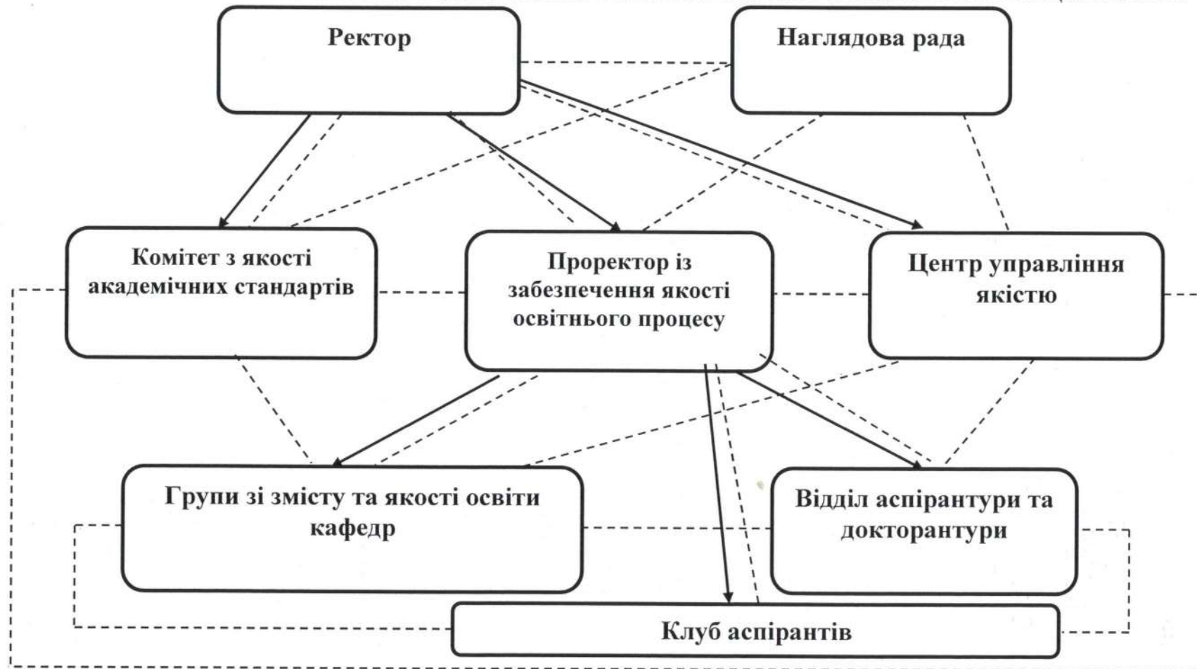
Рис 2. Організаційна структура системи внутрішнього забезпечення якості в Університеті імені Альфреда Нобеля