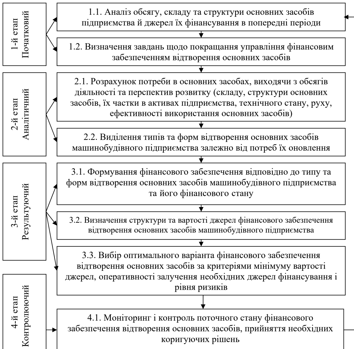
Рис. 1. Послідовність процесів управління фінансовим забезпеченням відтворення основних засобів машинобудівних підприємств

Для забезпечення машинобудівного підприємства в достатньому обсязі основними засобами, особливо активної їх частини, а також досягнення розумного зіставлення джерел формування фінансових ресурсів та фінансової незалежності з урахуванням можливості ризикової ситуації в роботі сформовано послідовність процесів управління фінансовим забезпеченням відтворення основних засобів машинобудівних підприємств (рис. 1).