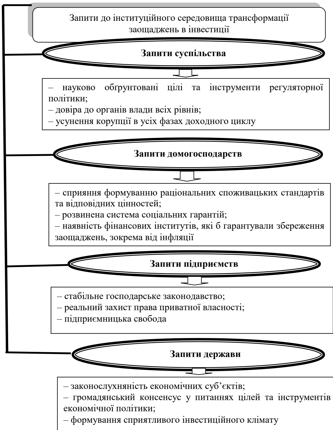
Рис. 2. Запити груп економічних суб'єктів до інституційного середовища трансформації заощаджень в інвестиції

У свою чергу, це підвищить надходження заощаджень до фінансових інституцій (гарантування вкладів фізичних осіб до інститутів спільного інвестування та реальний запуск другого й третього етапів пенсійної реформи), а також сприятиме заохоченню інвестиційної діяльності бізнесу (вивільнення від оподаткування лише тієї частини амортизаційних відрахувань, яка реально використовується на інвестиції, а не на споживання).