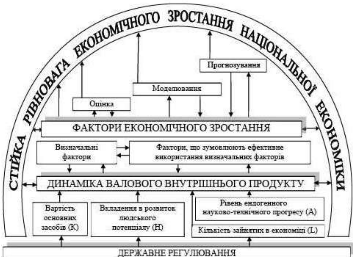
Рис. 2. Концептуальна схема дій щодо досягнення стійкої рівноваги економічного зростання національної економіки

У роботі сформовано концептуальну схему дій щодо досягнення стійкої рівноваги економічного зростання національної економіки (рис. 2).