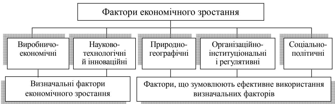
Рис. 1. Фактори економічного зростання національної економіки

Встановлено, що економічне зростання національної економіки зумовлено впливом і взаємодією взаємопов'язаних між собою факторів. Виходячи з особливостей сучасного економічного розвитку, систематизовано фактори економічного зростання національної економіки (рис. 1).