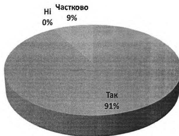
Рис. 1. Ознайомленість аспірантами з основними правилами цитування наукової інформації

У наступному питанні з'ясовувалось чи ознайомлені аспіранти з основними правилами цитування наукової інформації (рис. 1).